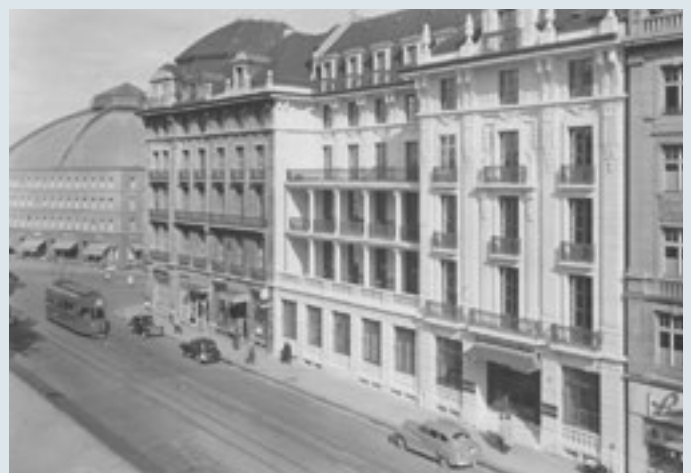
1930 wurde das Haus zum Hauptquartier der Bank für Internationalen Zahlungsausgleich, die nur zwei Jahre bleiben wollte. Sie blieb dort jedoch, bis sie 1977 in den BIZ-Turm umzog.