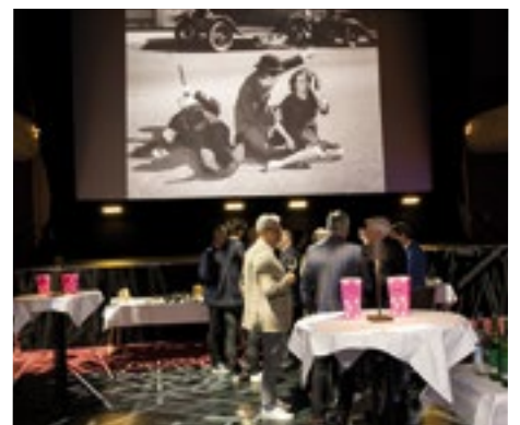
■ Raum für Gespräche: Im historischen Küchlin-Theatersaal ging es gemütlich zu und her.