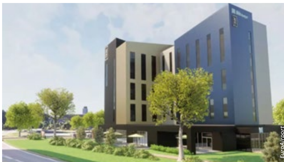
Der Komplex wird ein Zweisterne- und eine Viersterne-Hotel umfassen.

Mit dem Projekt reagiert der EuroAirport auf ein seit vielen Jahren bestehendes Bedürfnis nach einem Hotel direkt auf dem Flughafengelände. Insbesondere für früh abreisende oder spät ankommende Passagiere bedeutet das neue Angebot einen Komfortgewinn. Die Eröffnung der Hotels ist für Ende 2027 geplant.