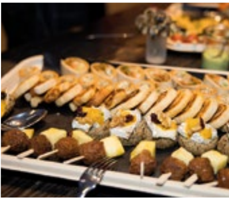
■ Die Apéro-Speisen stammten von verschiedenen Betrieben in der «Steinen».