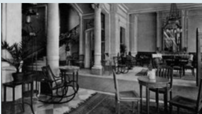
Die elegante Eingangshalle des Grandhotels.