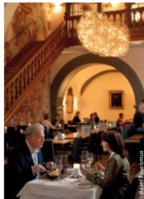
Die bediente Gastronomie ist unter Druck. Das zeigt sich auch bei der Entwicklung der Betriebszahlen.

Der Marktanteil von grossen Gruppen, Ketten und Systemen wird dennoch weiter zunehmen. Einzelbetriebe und Kleingruppen werden in der Kommunikations- und Freizeitgastronomie sowie in Nischen der Verpflegungsgastronomie ihren Platz behalten, letztlich aber stets von den Eigenleistungen der Inhaber abhängen.