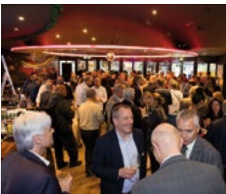
■ Ausgelassene Stimmung beim Apéro mit «Stein-Food».