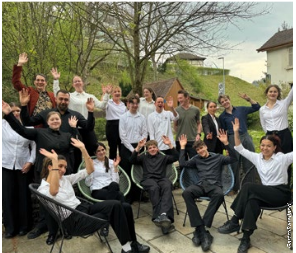
■ Begeisterung, die ansteckt: Angehende Restaurationsfachleute im überbetrieblichen Kurs.

Das Kurskonzept schafft Effizienz und eröffnet den Lernenden neue Perspektiven. Es fördert den Austausch, stärkt Kooperationen und ermöglicht Einblicke über den eigenen Fachbereich hinaus. Die Weiterentwicklung der gastgewerblichen Berufe lebt von Innovation und Zusammenarbeit.