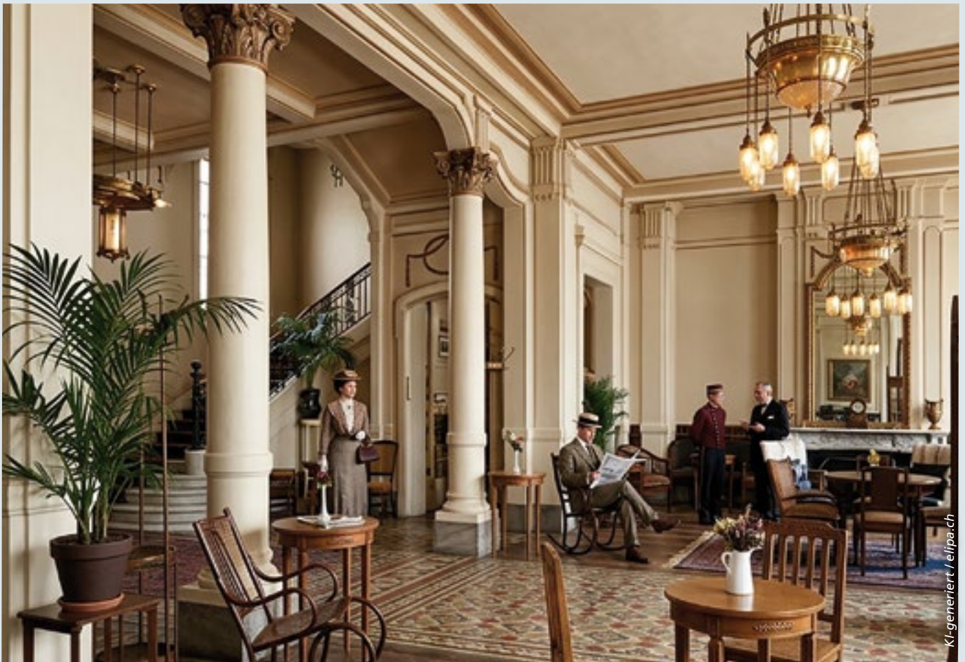
■ Die Speisekarte des Grandhotels kennen wir nicht. Vermutlich standen darauf Gerichte wie Hummer-Bisque, Tournedos Rossini und Crêpes Suzette.