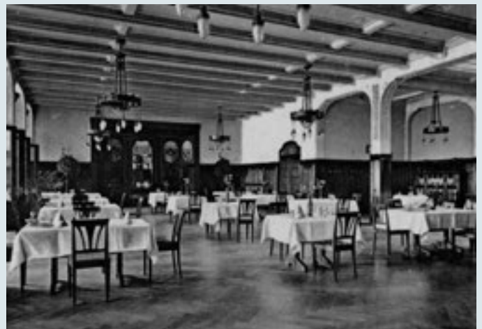
Der grosszügige Speisesaal des längst vergessenen Hotels.

An der Centralbahnstrasse gab es ein Grandhotel, an das sich kaum noch jemand erinnert. Dabei steht der fünfstöckige Jugendstilbau mit den säulengestützten Balkonen noch heute. Das Hôtel de l'Univers eröffnete anfangs des 20. Jahrhunderts, war aber offenbar nicht sonderlich erfolgreich. Vielleicht führte auch der Ausbruch des Ersten Weltkrieges zur Betriebsaufgabe. Das alte Grandhotel dient heute als Bürogebäude. Im Erdgeschoss befinden sich Läden.