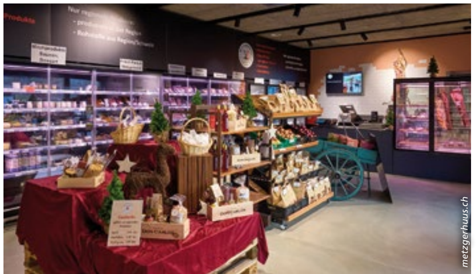
Im Selbstbedienungsladen «Regio Shop 365» gibt es über 400 Artikel von vierzig regionalen Lieferanten.