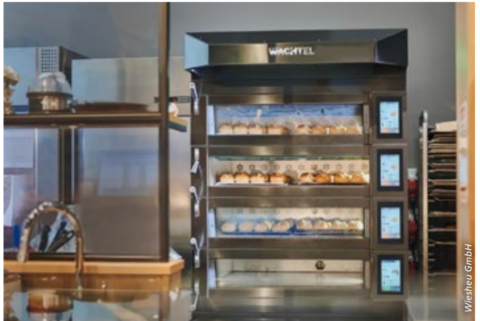
■ Zwischen 2002 und 2023 sind in Deutschland 52 Prozent der Bäckereien verschwunden.