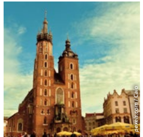
Der Tourismus in der südpolnischen Metropole Krakau boomt.

In Krakau befindet sich das erste und einzige Zweisterne-Lokal, die «Bottiglieria 1881». Bei Streifzügen durch die pittoreske Altstadt oder das jüdische Viertel Kazimierz lassen sich viele Restaurants, Bars und Cafés entdecken. Zu den lokalen Spezialitäten gehören Pierogi, mit Hackfleisch, Speck, Pilzen oder Sauerkraut gefüllte Teigtaschen.