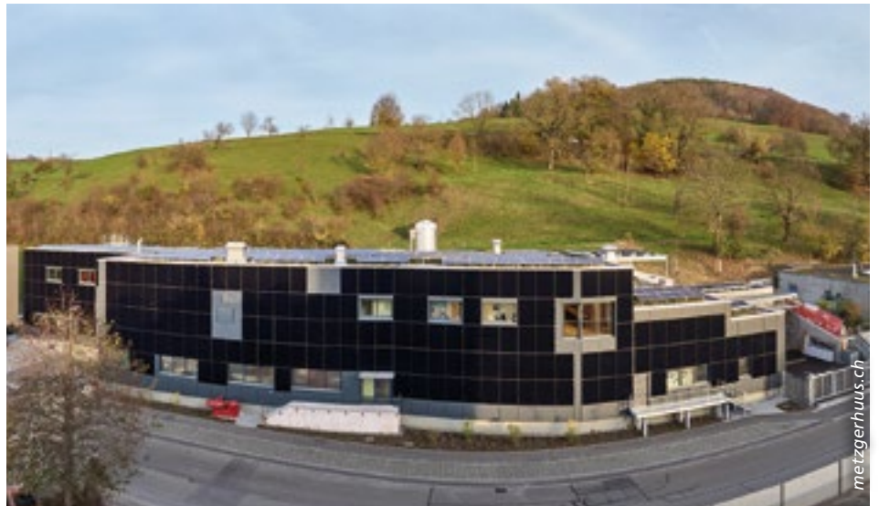
Das «Metzgerhuus Stadt und Land» in Füllinsdorf verzeichnete ein erfolgreiches erstes Betriebsjahr.