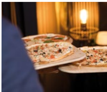
■ Die Flammkuchen der Brasserie Küchlin fanden reissenden Absatz.