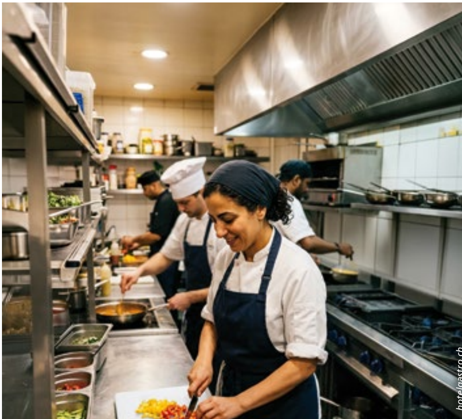
Die Teilnehmer werden schrittweise an den Arbeitsalltag im Gastgewerbe herangeführt und auf eine weiterführende berufliche Qualifikation vorbereitet.

Im ersten Halbjahr steht der Einstieg in den Arbeitsalltag mit Begleitung im Vordergrund. Diese Phase wird über bestehende Finanzierungsinstrumente unterstützt, was die Betriebe enorm entlastet. Im zweiten Halbjahr wird die Qualifizierung vertieft; diese Phase wird durch den Betrieb getragen. Im Anschluss sollen die Teilnehmer die Möglichkeit haben, einen EBA- oder EFZ-Abschluss anzustreben.