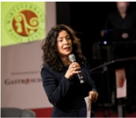
■ Finanzdirektorin Tanja Soland überbringt die Grüsse der Basler Regierung.