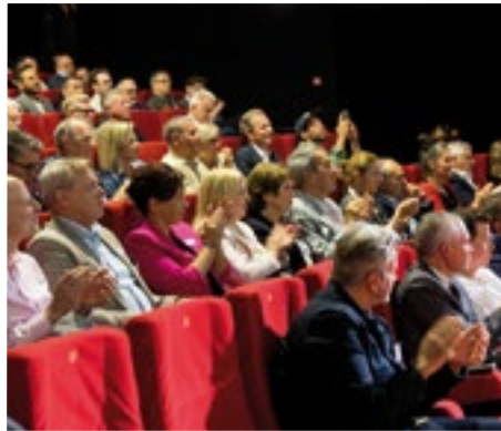
■ Gut gefüllte Ränge im alten Kino Küchlin, das momentan als «Saal 1» zwischengenutzt wird.