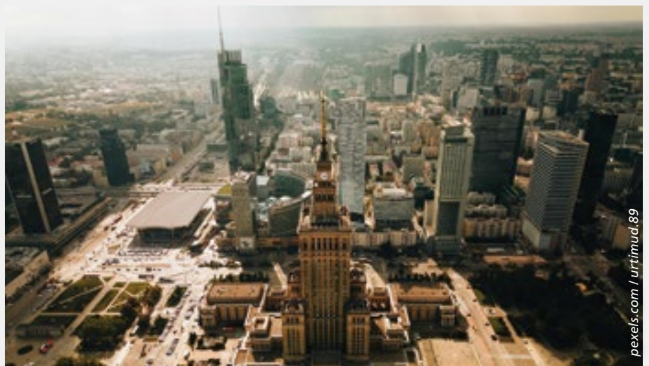
Die vielfältige Architektur von Warschau spiegelt die lange, turbulente Geschichte Polens wider.

Menschen in Polen, aktuell sind es noch gut 37 Millionen und 2050 könnten es laut Prognosen weniger als 33 Millionen sein.