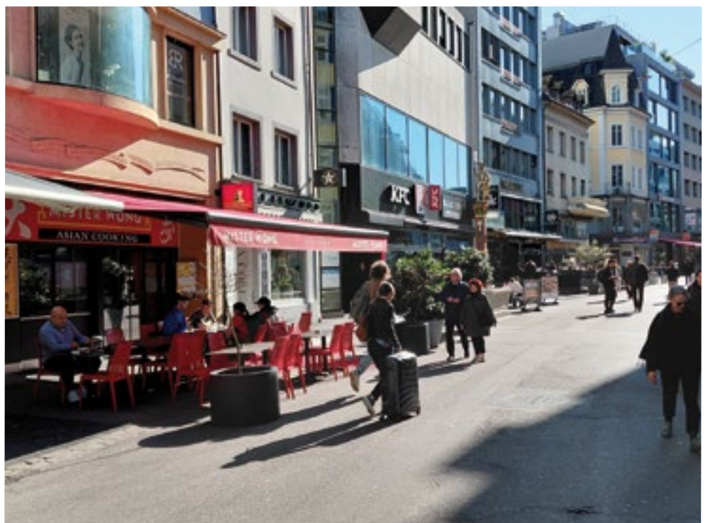
■ In der Steinvorstadt gibt es besonders viele Markenrestaurants. Von links: Mister Wong, KFC, Black Tap, weiter hinten Amorino und Burger King.