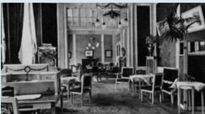
Der Damensalon und das Raucherzimmer.