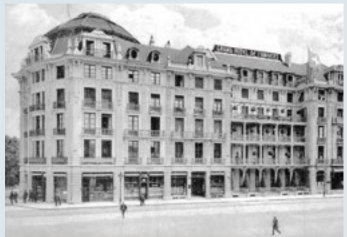
Das Grandhotel de l'Univers befand sich gegenüber dem Bahnhof.