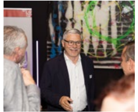
■ Alt-Regierungsrat Carlo Conti, der scheidende Präsident von Basel Tourismus.