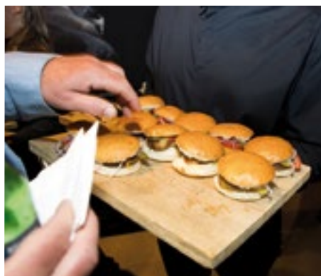
■ Das Food-Angebot war vielfältig, doch was wäre ein Apéro in der Steinen ohne Burgers?